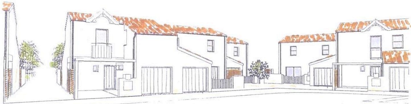
-Placette du lot 39-