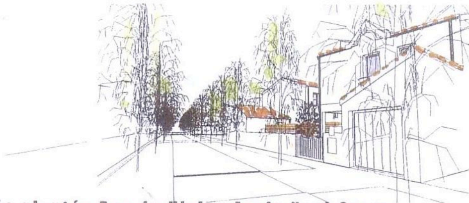
-Allée plantée Rue du Vivier-Angle Nord Ouest-