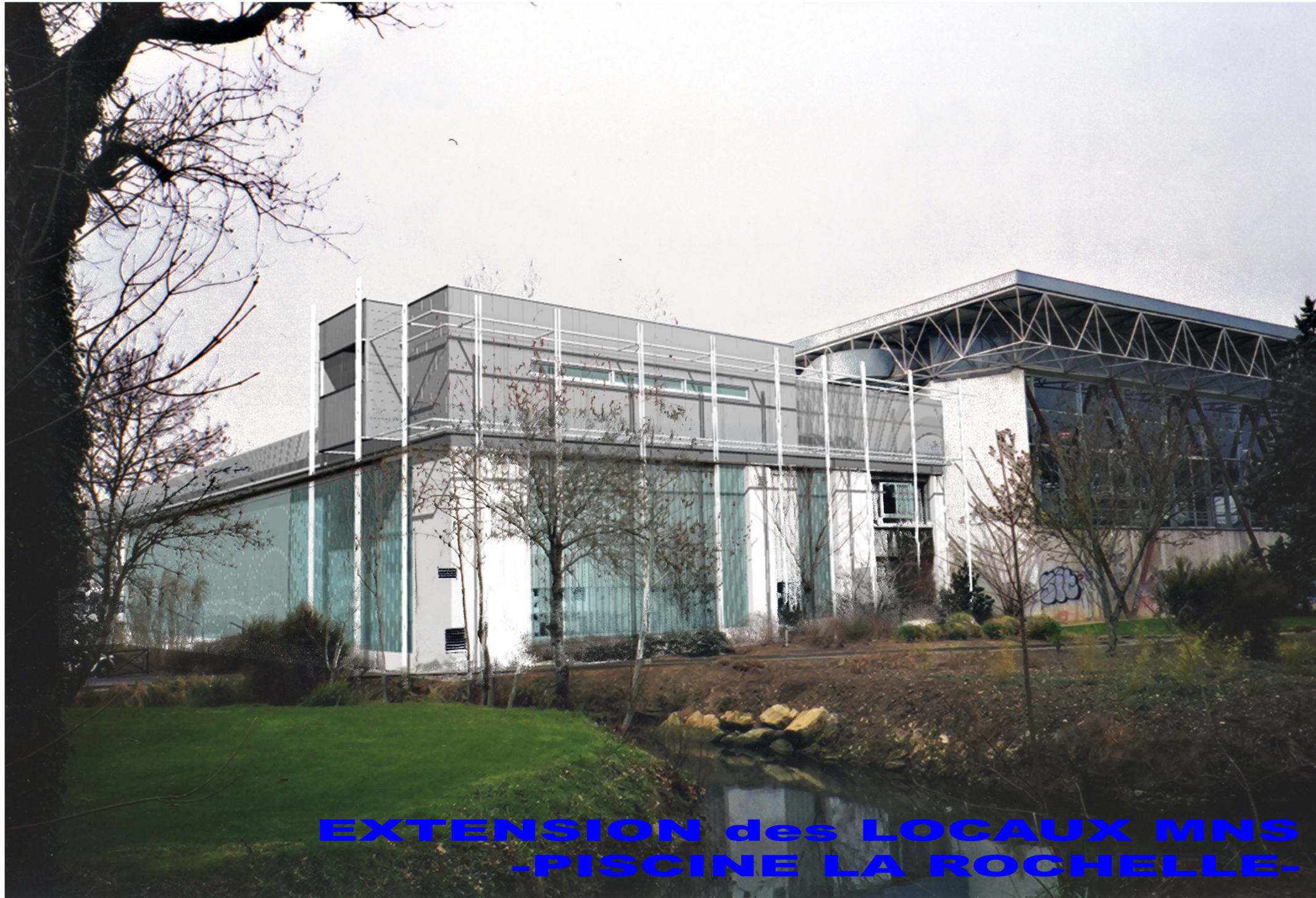
EXTENSION des LOCAUX MNS -PISCINE LA ROCHELLE-