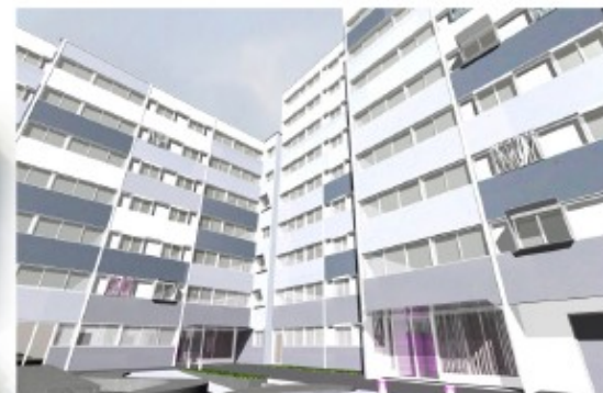
ENTREES des bâtiments 38 et 42