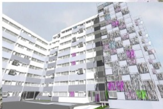
ENTREES des bâtiments 42 et 40