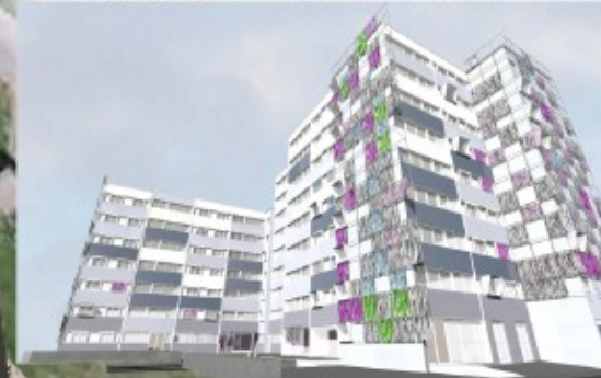
BATIMENTS 38 et 42

TOITURES et AMBIANCES DES CONSTRUCTIONS A REHABILITER